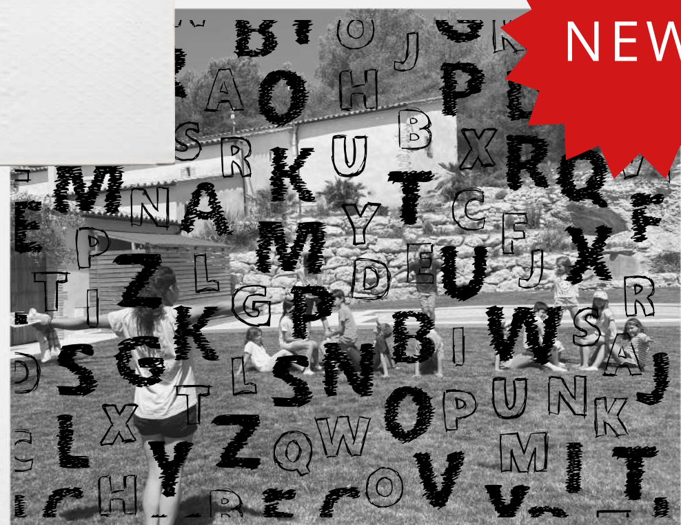
BIG SCATEGORY (VERSIÓ OUTDOOR)