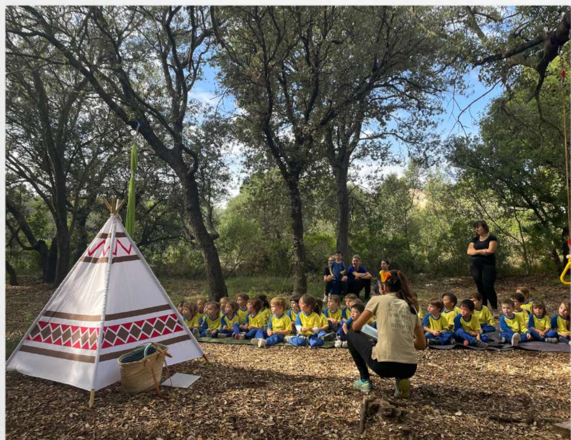
CONTA - CONTES