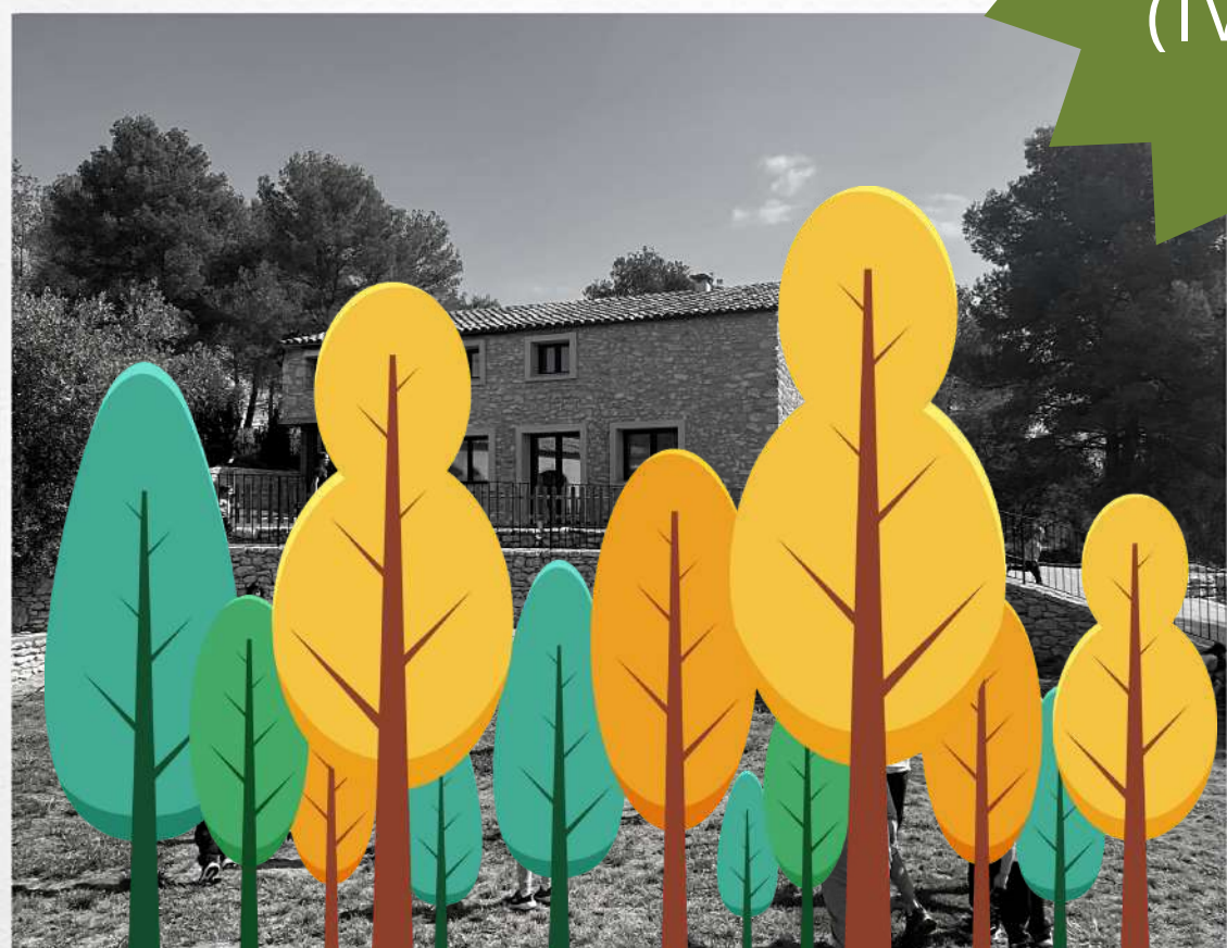
LA VIDA ALS ARBRES