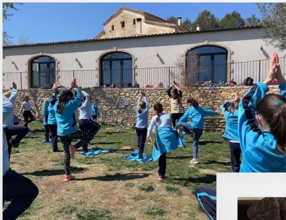
IOGA EN GRUP